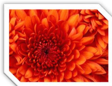
Slika 1: Cvet

(Dodati sliku u tekst, smanjiti je na proizvoljne dimenzije, tako da slika ne prelazi na drugu stranicu. Postaviti stil (okvir) po izboru.)